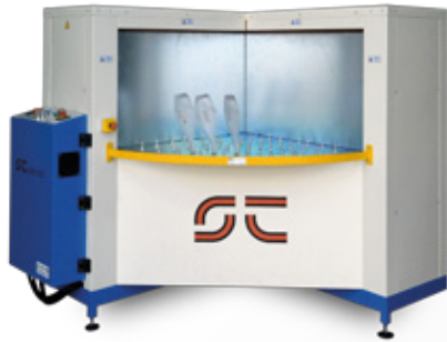
Particolare - Pannello di controllo

Forno per asciugatura della stampa serigrafica su bottiglie. Composto da una zona di carico/scarico, 2 zone riscaldate ed una zona di raffreddamento.