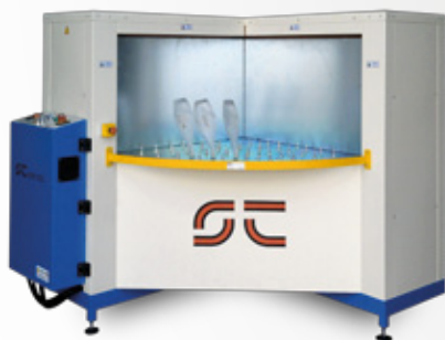
Particular - Control panel

Drying oven of the silk-screen printing on bottles. Composed by a load and unload zone, two drying zones and a cooldown one.